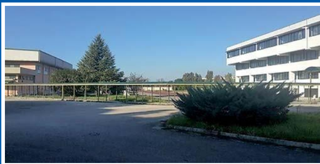
Liceo Scientifico "Edoardo Amaldi"